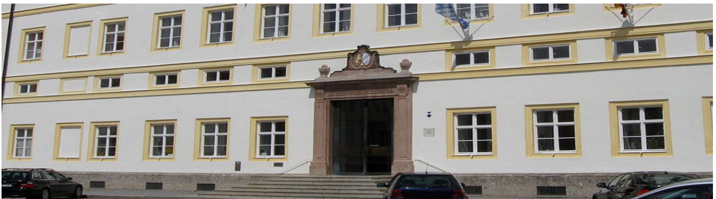
Hauptgebäude der Regierung von Niederbayern